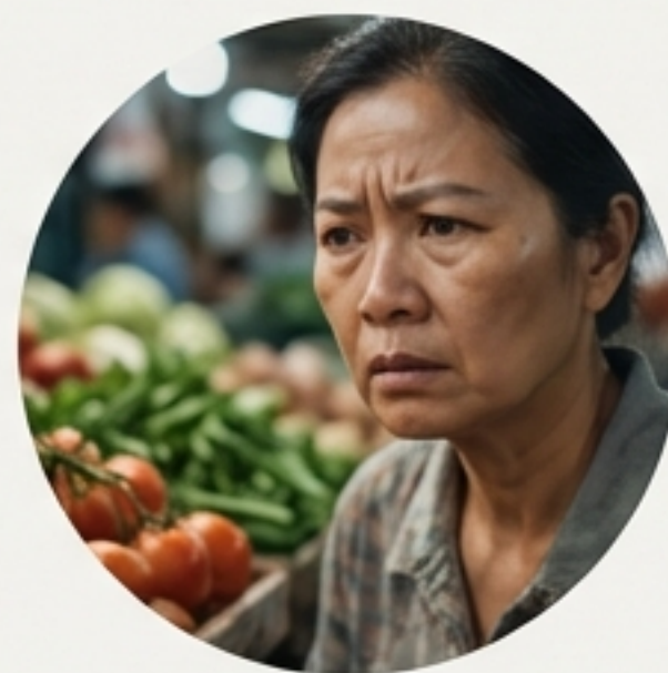
Nỗi lo người tiêu dùng

↗ Sự chuyển dịch này không còn là xu hướng của một nhóm nhỏ, mà là một nhu cầu thiết yếu của xã hội hiện đại.