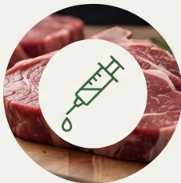
Dư lượng kháng sinh