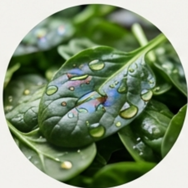
Hóa chất độc hại

Trong bối cảnh các vấn đề về thực phẩm bẩn, dư lượng kháng sinh và hóa chất độc hại ngày càng gia tăng, niềm tin của người tiêu dùng Việt Nam vào thực phẩm thông thường đang bị lung lay. Thái độ tiêu cực này không chỉ là một cảm giác, mà đã trở thành động lực chính thúc đẩy một sự thay đổi mạnh mẽ trong hành vi mua sắm, hướng tới các lựa chọn an toàn và minh bạch hơn.