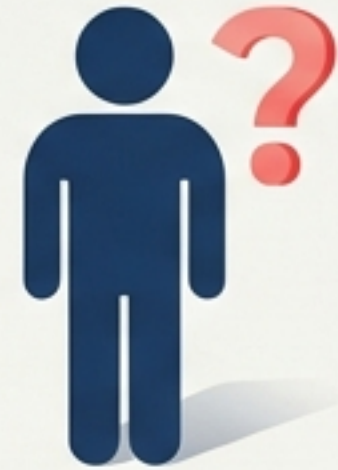
Bất kỳ ai (cả người nhà) chưa từng mắc bệnh thủy đậu trước đây.