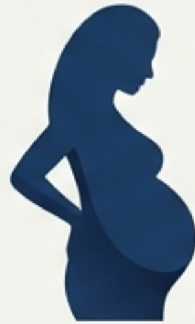
Phụ nữ mang thai.

Dù Zona thần kinh không lây trực tiếp thành Zona, nhưng tiếp xúc với dịch tiết từ mụn nước có thể lây truyền virus thủy đậu cho người chưa có miễn dịch. Người đang mắc bệnh cần tuyệt đối tránh tiếp xúc trực tiếp với: